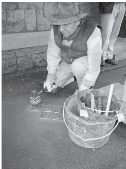
Gunter Demnig verlegt die Stolpersteine in Wiltingen.

Die Idee der Stolpersteine als Form der Erinnerung geht auf den Kölner Künstler Gunter Demnig zurück. „ Ein Mensch ist erst vergessen, wenn sein Name vergessen ist “, so Demnig. Die stets gleich gestalteten Pflastersteine tragen auf ihrer mit Messing eingefassten Kopfseite den Hinweis „ HIER WOHNTE “ dem der Name, Geburtsjahr und Ort, sowie das weitere Schicksal der Person folgen. Die Steine werden vor dem letzten freiwilligen Wohnort der NS-Opfer verlegt und durch Patenschaften finanziert. Dadurch, dass man über die Steine hinweg geht und so immer wieder über das Schicksal der ehemaligen Bewohner „ stolpert “, will man das Gedenken an die Menschen lebendig behalten. Erinnert wird nicht nur an jüdische Opfer, sondern auch an andere von den Nationalsozialisten während des Dritten Reiches verfolgte Gruppen wie Sinti und Roma, politisch Andersdenkende, Mitglieder von Widerstandsbewegungen, Homosexuelle und Zeugen Jehovas. Bis Ende September 2007 wurden mehr als 12.500 Erinnerungssteine in 277 Ortschaften in ganz Deutschland verlegt.