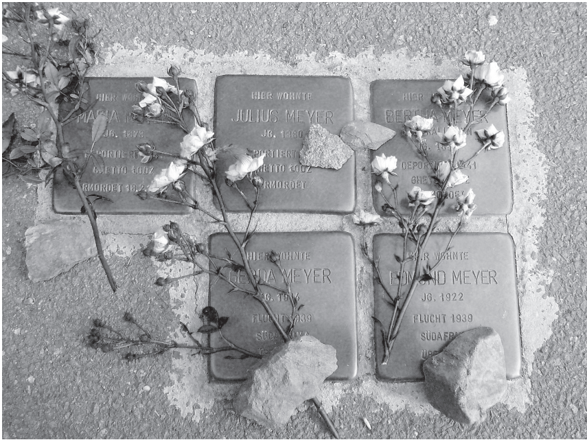
Die Stolpersteine in Wiltingen, von der Familie mit Rosen und nach jüdischer Tradition kleinen Steinen verziert.